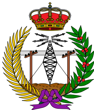
Figura 3: Emblema de los ingenieros de Telecomunicación de España.