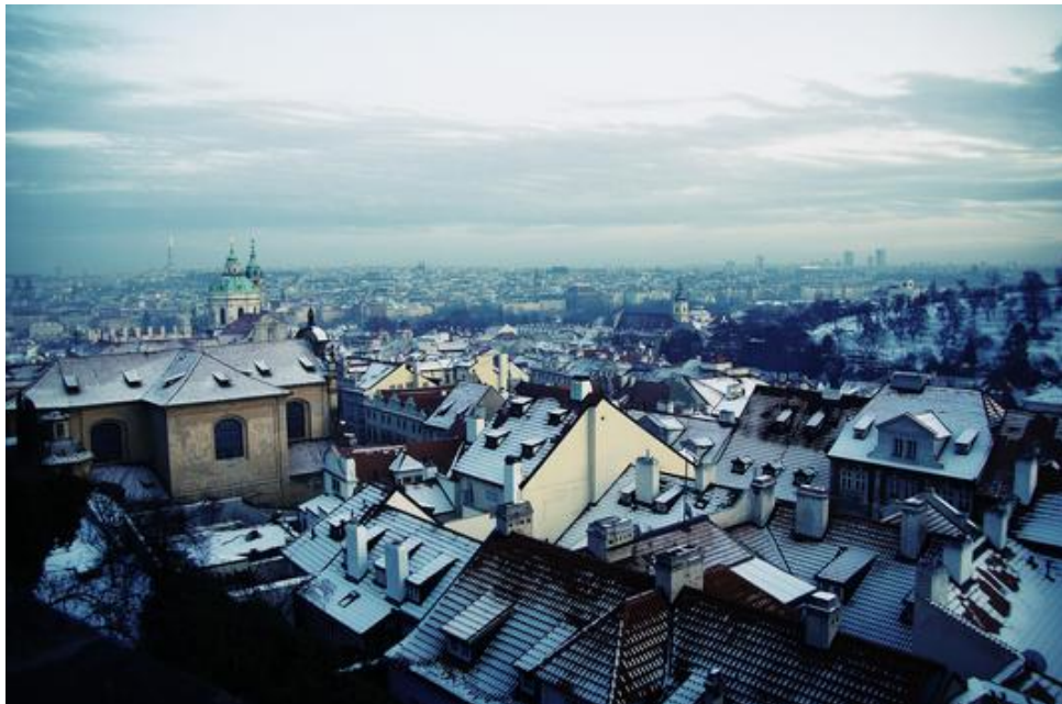
Figura 2.1: Lorem ipsum dolor sit amet, consectetur adipiscing [1].

Insertamos una figura y la referenciamos, ver Figura 2.1.